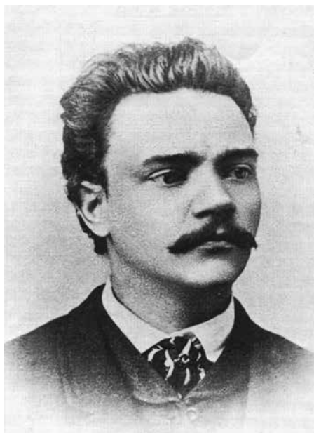
Den 27-årige Antonín Dvořák For Dvořák var den böhmiske og slovakiske folkemusik en strømmende kilde til livslang inspiration.

Anden del er anderledes. Her spiller instrumenterne samtidigt, i tostemmige forløb af stor finesse. Det er de lange linjers musik, som spilles indadvendt og lyttende – kun afbrudt af et mere dramatisk og udadvendt midterafsnit.