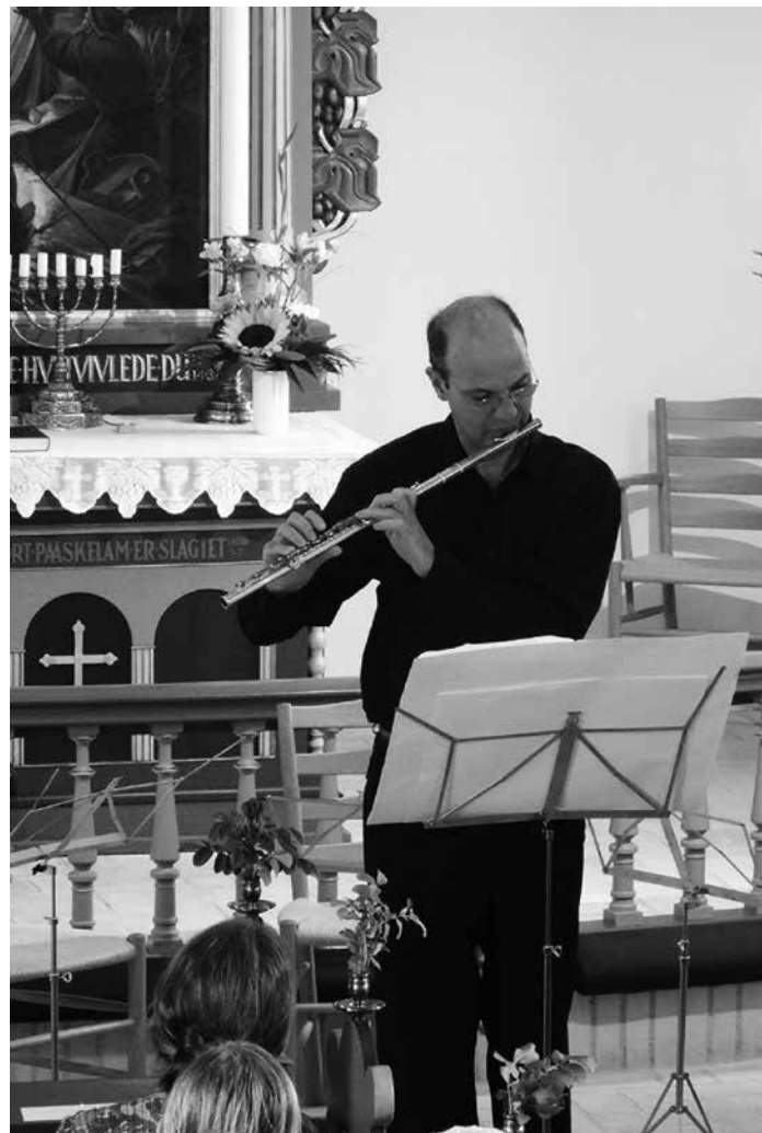
Klitmøller Kirke 2014 Craig Goodman