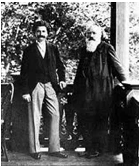
De to nære venner, Johann Strauss (den yngre) og Johannes Brahms, er her fotograferet i Wien 1894.

I 1862 rejste Brahms første gang til Wien, hvor han fra 1868 tog blivende ophold. Opførelsen af hans største værk for kor og orkester, Ein deutsches Requiem , blev en succes, der placerede den 35-årige som en af tidens største