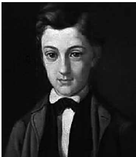
Emil Hartmann som 15-årig. Constantin Hansens portræt fra 1851

Den danske komponist og organist Emil Hartmann (1836-98) blev undervist i teori og komposition af sin far, J.P.E. Hartmann (1805-95, en hovedskikkelse i 1800-tallets danske musikliv). Allerede i barnealderen gav Emil Hartmann prøver på sin musikalske begavelse, således i de senere udgivne Smaasange for Ungdommen . Hans egentlige debut som komponist fandt sted i Frue Kirke skærtorsdag 1858. Her opførte teaterkoret en passionsalme (Ingemann) for sopransolo, kor og orkester af den 22-årige Emil Hartmann. Efter denne lovende begyndelse, der også omfattede musik til Bournonvilles ballet Fjeldstuen (1859, sammen med August Winding), drog Hartmann