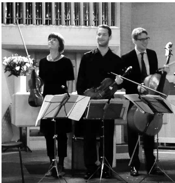
Stavnsholt Kirke, Farum