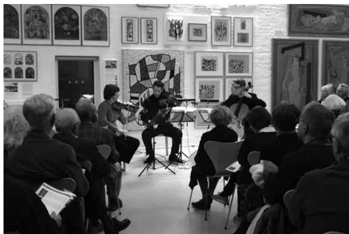
Skissernas Museum, Lunds Universitet