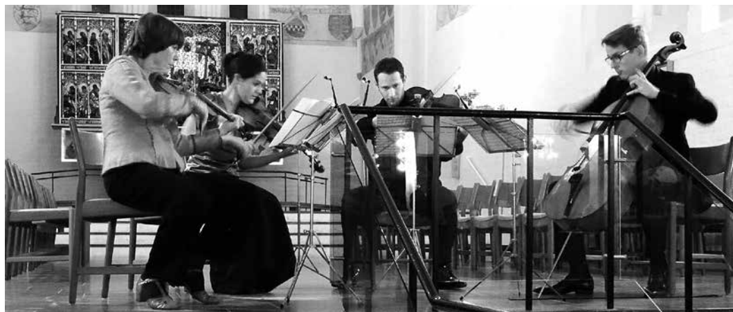
Vor Frue Kirke, Aarhus