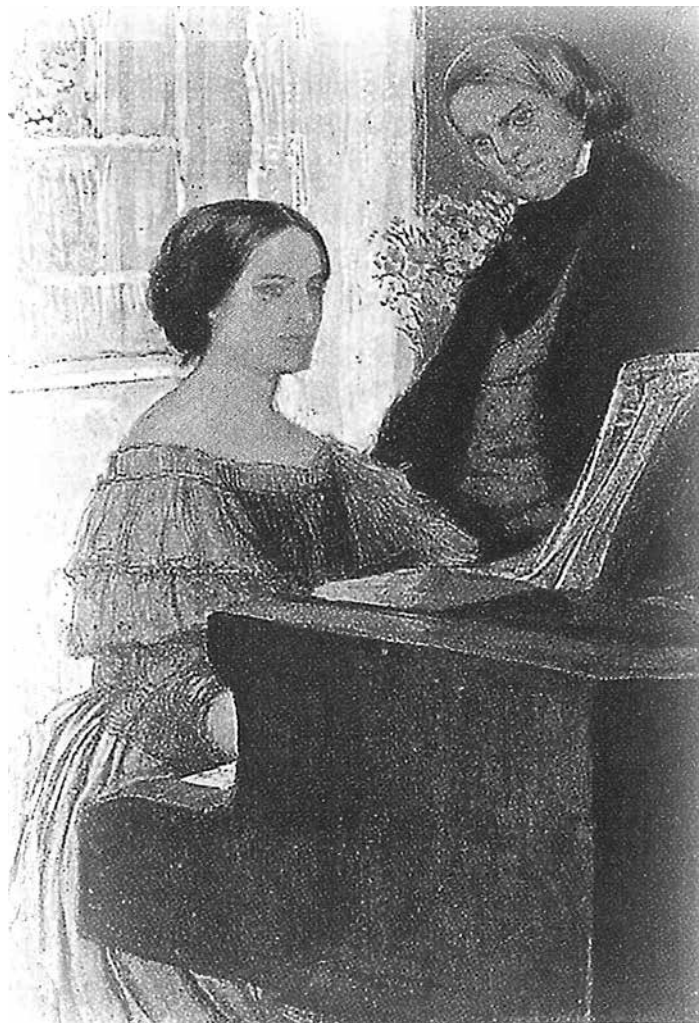
Clara Schumann spiller, mens ægtemanden Robert Schumann lytter. Anonymt, udateret maleri

trapunktisk med hovedtemaet i første sats, der nu spilles i forlængede noteværdier (augmentation). Derved føres fjerde sats og hele værket til en monumental slutning.