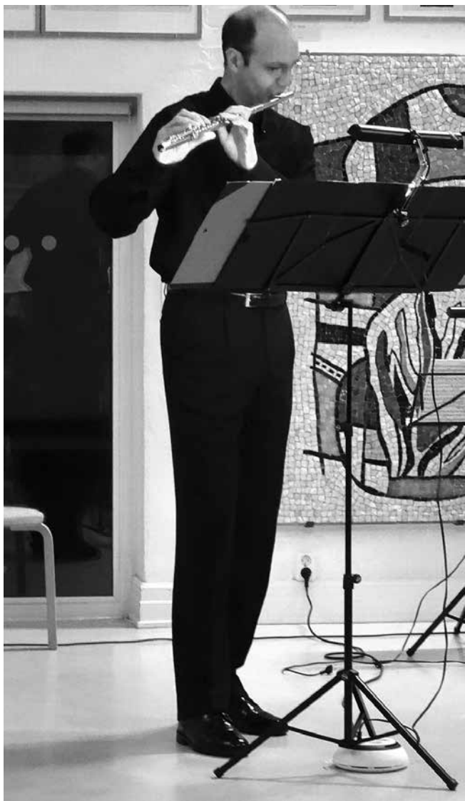
Skissernas Museum, Lunds Universitet