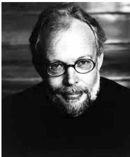
Poul Ruders (f. 1949)

gerne i den internationale violinkonkurrence i Odense 2004. I stedet for at komponere et konventionelt virtuost stykke besluttede Ruders at komponere et værk præget af indadvendt eftertænksomhed. Bel Canto betyder "Smuk Sang", og værket er da også præget af smukke melodier. Spilleanvisningen er Cantabile sempre (Altid sangbart) , og værket bliver derfor en studie i udholdte melodiske linjer af forfinet klanglighed. Som en velkommen kontrast indskyder Ruders dissonerende dobbeltgreb, som følger en bidende og smertelig nuance til musikkens udtryk. Som helhed antager værket derfor karakter af en trøstesløs klagesang.