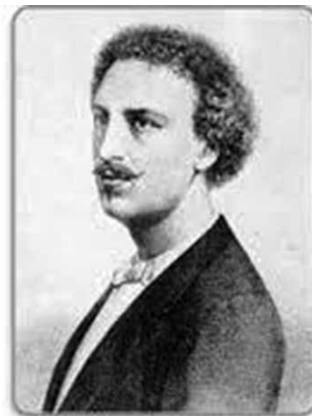
Asger Hamerik (1843-1923)

sin udsøgte harmonisering og sin klanglige skønhed.