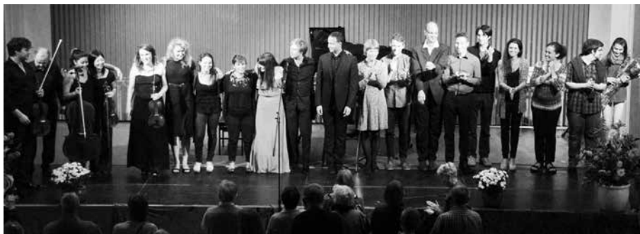
Thisted Musikteater, afslutningskoncert 2014