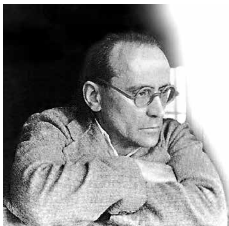
Anton Webern (1883-1945)

dition. De unge komponister, heriblandt Karlheinz Stockhausen, Pierre Boulez, György Ligeti og Luigi Nono, tog Weberns musik til sig og lagde den til grund for deres egne studier og eksperimenter, som førte til den såkaldte Darmstadt-serialisme . Siden da har Weberns værker været pensum på professionelle musikuddannelser over hele verden (se note om Darmstadt og serialisme i programbog 2009 side 21).