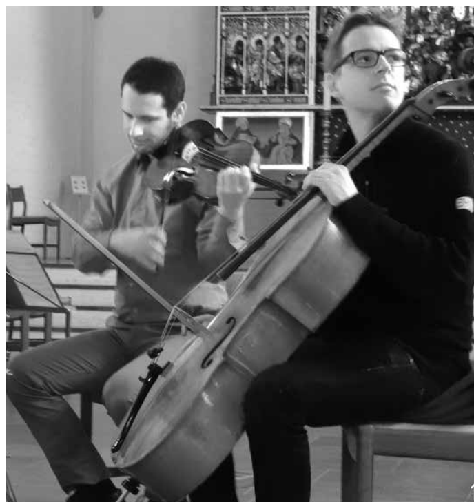
Vor Frue Kirke, Aarhus