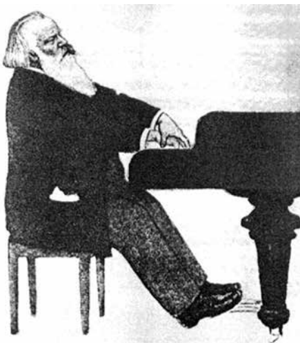
Johannes Brahms ved klaveret.

Johannes Brahms (1833-97) komponerede sin anden klavertrio i C-dur op. 87 i 1883. Trioen er stort anlagt, mangfoldig i sin temarigdom og harmonisk og rytmisk kompliceret. Det er strygerne, der i de fleste tilfælde præsenterer værkets temaer, medens klaveret går sine egne veje, ikke mindst i rytmisk henseende. Således lader Brahms ofte klaveret spille i todelt takt samtidig med, at strygerne spiller i tredelt. Denne rytmiske to mod tre-komplication er et kendetegn for Brahms' stil – et kendetegn, som den unge Carl Nielsen (1865-1931) fandt fascinerende, og som han tog til sig.