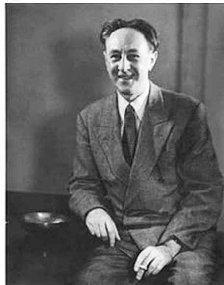
Bohuslav Martinů (1890-1959) fotograferet i New York 1945

I den musikantiske og livsglade tredje sats, Allegretto , vender dansemusikken tilbage i vekslende taktarter.