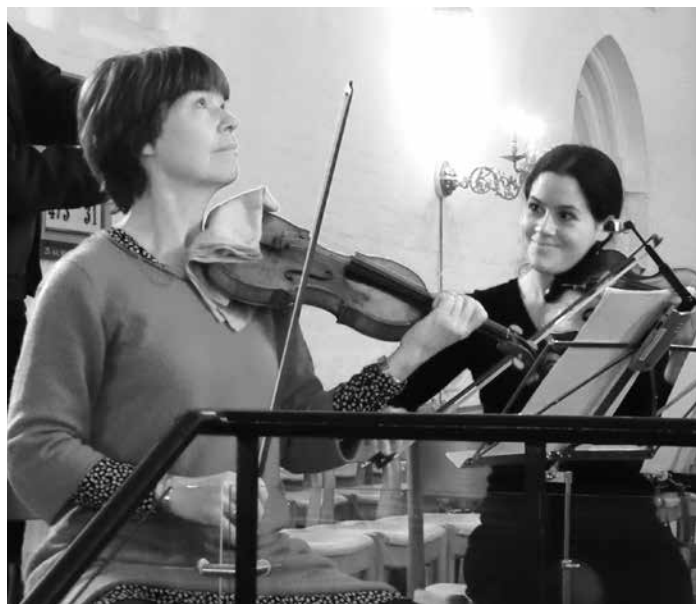
Vor Frue Kirke, Aalborg