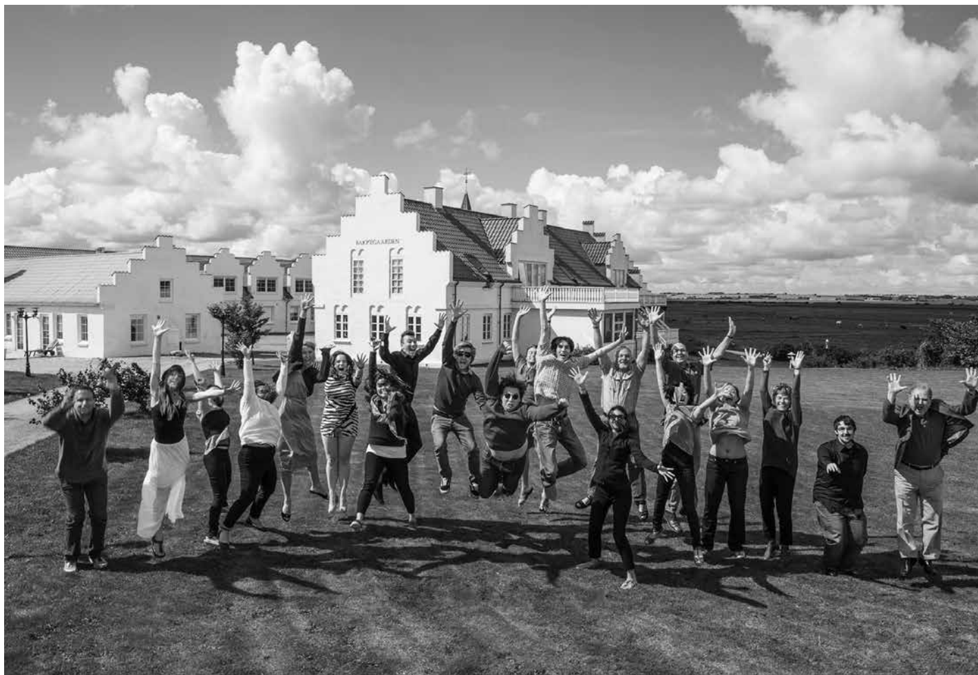
Thy Kammermusikfestivals musikere 2014