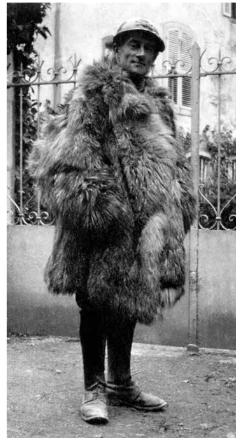
Maurice Ravel, soldat i 1916

Ravels mor var baskisk, og trioer rummer træk fra baskisk dansemusik. I øvrigt er den komponeret under et ophold i en baskisk provins i Sydfrankrig. Ravel havde ikke erfaring med klavertrioer, og han måtte arbejde temmelig hårdt for at nå det ønskede resultat. Ravel benytter ofte de enkelte instrumenters ekstreme registre og skaber en musikalsk tekstur med koloristiske effekter. Komponistens krav til de tre udøvende er betydelige.