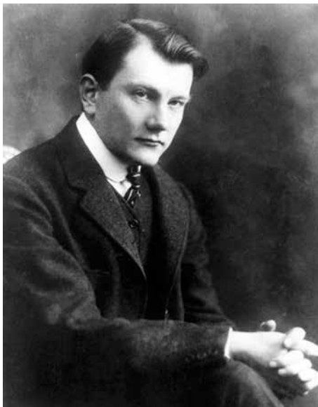
Ernst von Dohnányi (1905)

Ernst von (eller Ernö ) Dohnányi (1877-1960) var en ungarsk komponist, pianist og dirigent, hvis navn lejlighedsvis dukker op på danske koncertprogrammer. Han var en ret produktiv komponist og skrev værker for orkester (et par symfonier og flere koncerter for klaver og violin), for scenen (tre operaer) samt en del klavermusik og kammermusik. Her huskes han især for sin Klaverkvintet no. 1 i c-mol og for Serenaden for strygetrio i C-dur, opus 10.