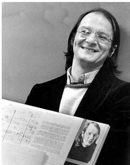
Claude Vivier i Montreal 1980.