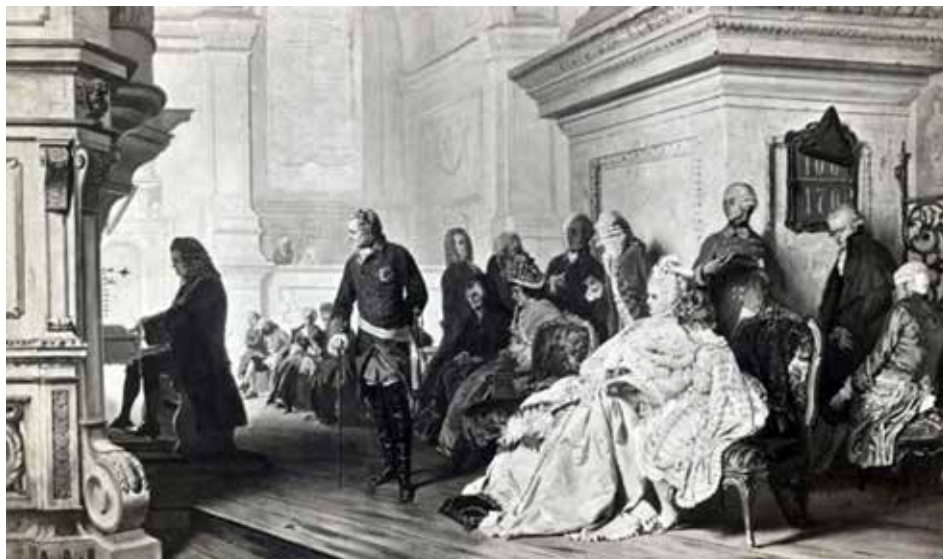
Johann Sebastian Bach på orgelet foran Frederik den 2., af Hermann Kaulbach

non'er samt en triosonate, Sonata sopr'il Soggetto Reale . Bach lader en fløjte spille det ene melodiinstrument som en særlig gestus til den fløjtespillende konge. Sonaten har fire satser og form som en barok kirkesonate i en stil, som passede til hoffets smag.