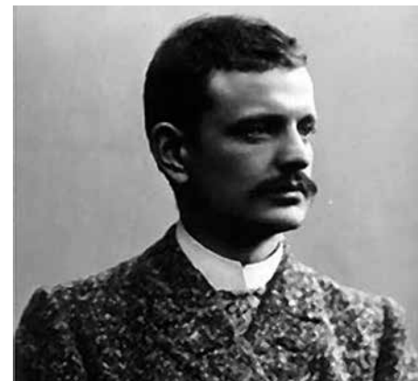
Jean Sibelius, 1891

kerne står Strygekvartetten i d-mol, Voces intimae ( Indre Stemmer ), opus 56 fra 1909, ret alene. Det var hans fjerde strygekvartet men den eneste, som fik et opusnummer. Titlen antyder en form for samtale eller konversation med et vist indadvendt præg. Fra London skrev han hjem til sin kone Aino: Den er blevet noget helt vidunderligt, den slags som bringer et smil på læben selv i dødens stund – men jeg vil ikke sige mere . Strygekvartetten blev førsteopført i 1910, og i anmeldelserne kunne man bl.a. læse: "Kompositionen tiltrak sig stor opmærksomhed, og den er utvivlsomt en af de mest brillante i sin genre. Det er ikke et værk for det almindelige publikum, den er excentrisk og noget ganske ud over det sædvanlige".