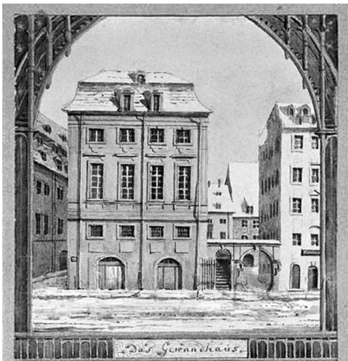
Komponisten Felix Mendelssohn lavede denne akvarel af Gewandthaus, som Niels W. Gade overtog ledelsen af efter ham.

Bortset fra Elverskud forsvandt Gades værker hurtigt fra orkestrenes repertoire efter hans død i 1890. Men ikke mindst hans omfattende produktion af kammermusik betragtes i dag som betydningsfuld, selv i international sammenhæng. Som violinist dyrkede han kammermusik med kollegerne i Leipzig – Felix Mendelssohn, Clara Schumann, Ferdinand David og Joseph Joachim, for at nævne nogle af de mest berømte. De i alt 15-20 værker blev komponeret i korte, koncentrerede perioder.