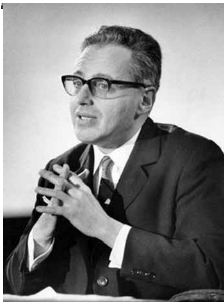
György Ligeti ca. 1965

Guillaume Dufay (ca. 1397-1474), Clément Janequin (ca. 1485-1558), John Taverner (ca. 1490-1545) og Carlo Gesualdo (1566-1613) var renaissancekomponister fra hhv. Burgund, Paris, London og Italien. Dufays Ma belle dame souveraine er en rondeau, en meget populær digterisk og musikalsk genre i samtiden. Taverners Gloria er en sats fra en messe over en gammel melodi, Westron Wynde , og Janequins Le chant des oiseaux er en såkaldt program-chanson, en sang, som efterligner fuglesang. Gesualdos Moro lasso er en af komponistens berømte og berygtede madrigaler. Gesualdo var en meget atypisk komponist, særdeles højt begavet, men som fyrste skrev han musik for sin egen skyld, ikke for et marked, og hans klangverden minder ikke om noget andet fra samtiden.