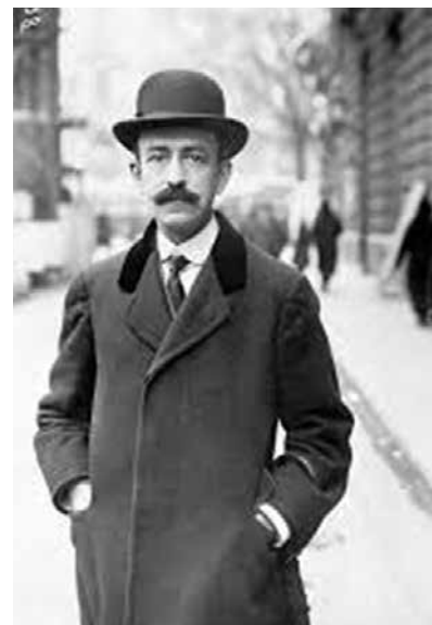
Manuel de Falla (1914)

Sangene var i det store og hele færdigkomponerede, da krigen brød ud i 1914 og tvang de Falla fra Paris og hjem til Spanien. De blev uropført i 1915 med komponisten selv ved klaveret. Her er sangene arrangeret af Ensemble Intercolor.