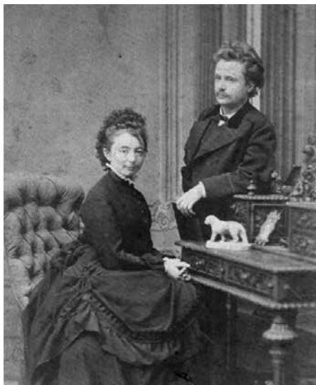
Bryllupsbillede af Nina og Edvard Grieg i 1867

Lyriske Stykker for klaver , en mængde sange og en håndfuld kammermusikværker, bl.a. tre violinsonater, en strygekvartet og en cellosonate.