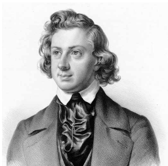
Niels W. Gade, 1845

Strygeoktetten for fire violiner, to bratscher og to celli i F-dur op. 17 er komponeret 1848-49, hvor Gade lige var kommet tilbage til Danmark. Det var også kort tid efter Mendelssohns død, og oktetten er blevet set som en hyldest til Mendelssohn, som havde betydet alt som mentor og ven for den unge Gade. Meget i både karakter og musikalsk opbygning viser indflydelse fra Mendelssohn.