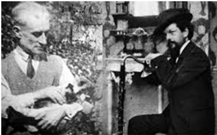
Maurice Ravel og Claude Debussy

Maurice Ravel (1875-1937) Sonate for violin og cello er komponeret 1920-22 og tilegnet Debussy, som døde i 1918.