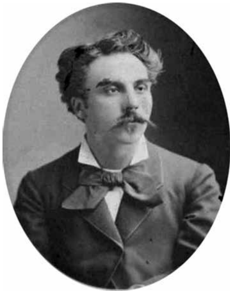
Gabriel Fauré i 1875

Gabriel Fauré (1845-1924) er en af de centrale franske komponister i det sene 1800-tal og i det tidlige 1900-tal. I Danmark er han formodentligt mest kendt for sit fine Requiem fra 1890, der ofte opføres i en udgave for kor, solister og orgel. Mange af os, der har sunget i kirkekor, har nydt at synge denne klangskønne musik. Man kan måske undre sig over, at Fauré er sprunget over teksten om Dømedag (som Verdi så dramatisk har tonesat), men som komponist var han tydeligvis mere lyrisk end dramatisk anlagt.