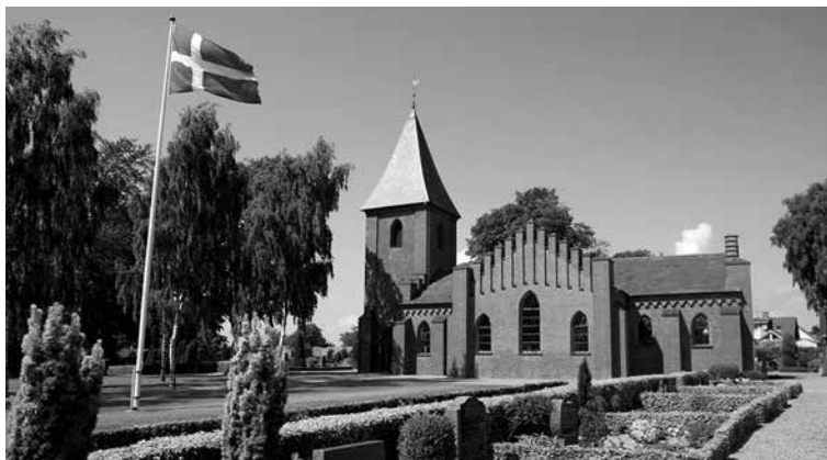
Ansgarkirken, Øster Jølby