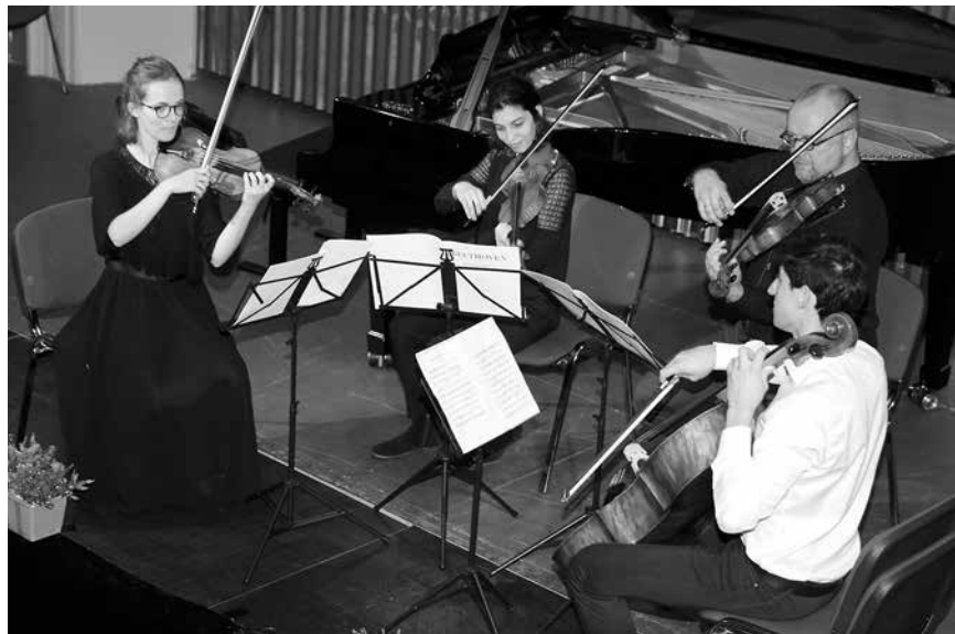
Thisted Musikteater 2018

Desuden specielle værker spillet af alle festival deltagerne, men først annonceret ved koncerten