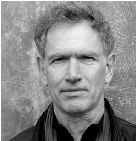
Hans Abrahamsen modtog tidligere på året Sonnings Musikpris

Hans Abrahamsens (f. 1952) engagement i ny musik går tilbage til barndommen, hvor han stiftede bekendtskab med værker af bl.a. Per Nørgård, Pelle Gudmundsen-Holmgreen og Henning Christiansen. Han blev senere optaget på Det Kgl. Danske Musikkonservatorium med horn som hovedfag. Bifagene musikteori og komposition fængslede ham hurtigt. I konservatorietiden sluttede Hans Abrahamsen sig til "Gruppen for alternativ musik", som stod for en åben programpolitik med opførelser af værker uden forudgående censur, og som politisk markerede sig på venstrefløj. Han videreuddannede sig privat som komponist hos Per Nørgård og György Ligeti.