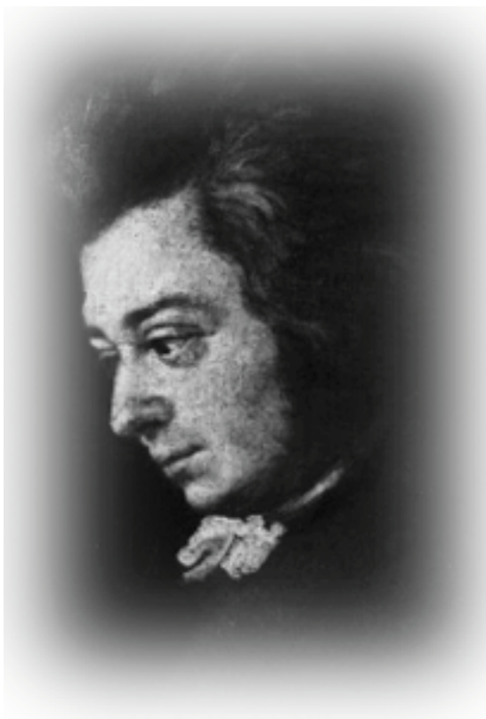
Wolfgang Amadeus Mozart, detalje af ufuldendt maleri af Mozarts svoger Joseph Lange 1789-90. Billedet blev af hans kone anset for at være det mest vellignende portræt af Mozart.

Wolfgang Amadeus Mozart (1756-91) Klarinetkvintet i A-dur K 581 (1789)