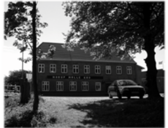
Morup Mølle Kro