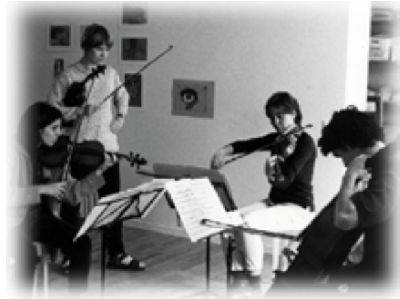
De fire lærere i arbejde