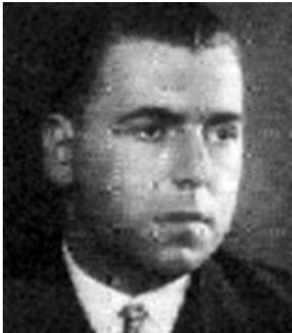
Erwin Schulhoff (1894-1942)

Concertino for fløjte, bratsch og kontrabas (1925)