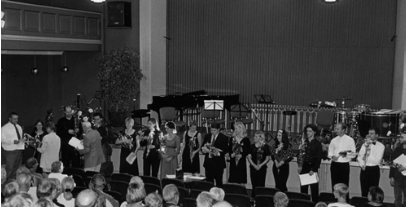
Afslutningskoncert TM 2003