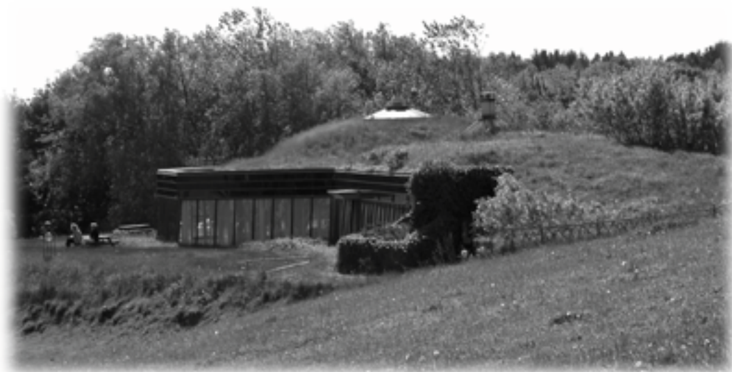
Folkecentret for Vedvarende Energi

Enkeltsatser fra repertoiret Program udleveres ved koncerten