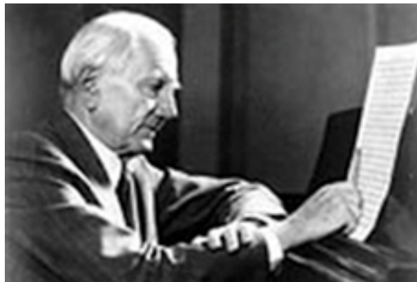
Ernst von Dohnányi

I 4. satsen efterfølges det enkle folkesangsagtige tema i g-mol af fire karaktervariationer, dvs. variationer, der fjerner sig mere og mere fra udgangspunktet. Til sidst klinger temaet sagte og "Più adagio" i det høje bratschleje harmoniseret i en klar G-durtonalitet. 5. sats er en rastløst fremstormende rondo i C-dur, hvor temaets sidste genkomst erstattes af et citat fra 1. satsen: mellemdelens cellomelodi med akkompagnerende marchrytmer, denne gang præsenteret i bratschen. Med tydelig reference til Brahms' cykliske formning etablerer Dohnányi dermed en stærk sammenhæng mellem værkets begyndelse og slutning – med en ejendommelig mørk udklang på serenaden til følge.