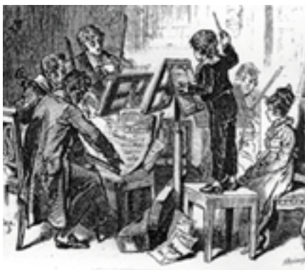
Romantiseret tegning, der viser Felix Mendelssohn Bartholdy som musikalsk vidunderbarn i færd med at dirigere, medens søsteren Fanny ser til.

melodiske skønhed, harmoniske rigdom og musikalske vægtfylde begejstrede 1800-tallets højborgerlige publikum, ved hvis musikalske soiréer Mendelssohns kammermusik var standardrepertoire.