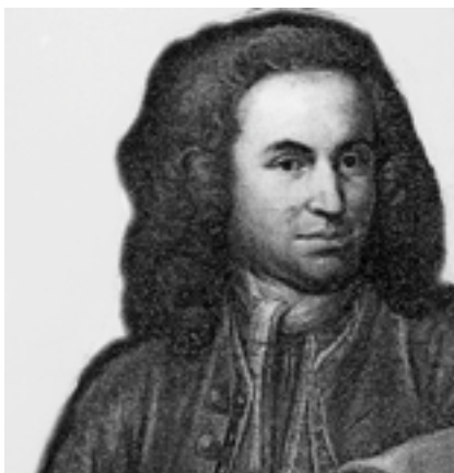
Johann Sebastian Bach som 30-årig i 1715, da han var vicekapelmester ved hoffet hos hertug Wilhelm Ernst af Sachsen-Weimar.

Alligevel blev Bachs musik stort set glemt efter hans død; men ikke mindst Mendelssohn Bartholdys berømte opførelse af Matthäuspasjonen i 1829 førte til en opblussen af beundringen for Bachs musik, som ikke er aftaget siden.