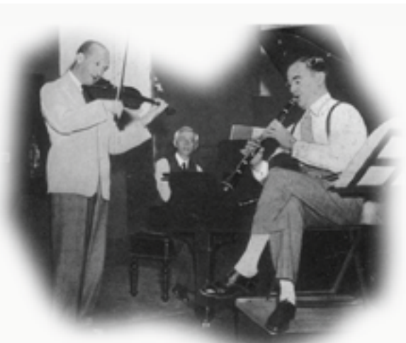
På billedet forbereder Bartók (ved klaveret) i 1943 en opførelse af Kontraster med Benny Goodman og Joseph Szigeti.

som hovedskikkelse i europæisk musik. Men med Hitlers magtovertagelse i Tyskland i 1933 ændrede Bartóks situation sig afgørende.