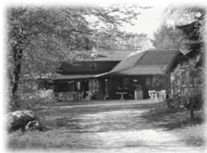
Kirsten Kjær's Museum